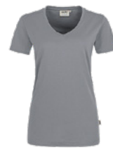
443 hp titan