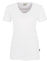
401 hp weiß

Ursprungsland Laos Zolltarifnummer 6109 9020 Datenblatt Stand: 11/2023