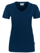
434 hp tinte