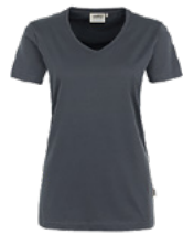
428 hp anthrazit