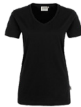
405 hp schwarz