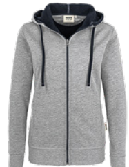
015 grau meliert/tinte