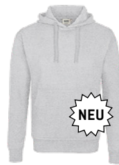
024 ash meliert