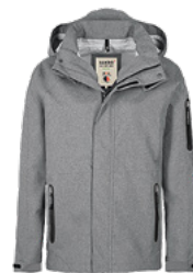
315 dunkelgrau meliert