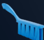
UST Handfeger, Weich Artikelnummer: 4581x