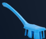
UST Handbürste m/ langem Griff, Hart Artikelnummer: 4196x