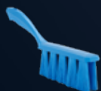
UST Handfeger, Medium Artikelnummer: 4585x